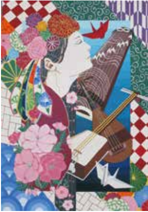
第27回全国高等学校総合文化祭優秀校東京公演ポスター 優秀賞 五十嵐 夢衣