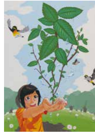
第69全国植樹祭大会ポスター原画及び 平成29年度国土緑化運動・育樹運動ポスター原画 最優秀賞 葛西 由佳