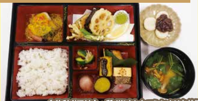
食物科が田植え・稲刈りをしたコシヒカリを使用