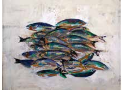
第11回西会津国際芸術村公募展2016 青少年の部 準大賞